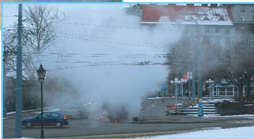
My máme parní stroj, obrovské síly zdroj - mohli jsme si notovat na Anglickém nábřeží.

Samotná oprava odvzdušňovací trubky a ventilu byla záležitostí půl druhé hodinky, zbytek času zabralo opět napouštění potrubí horkou vodou. Takže - dobrá práce!