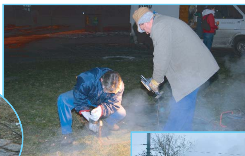
▲ Noc na místě činu.