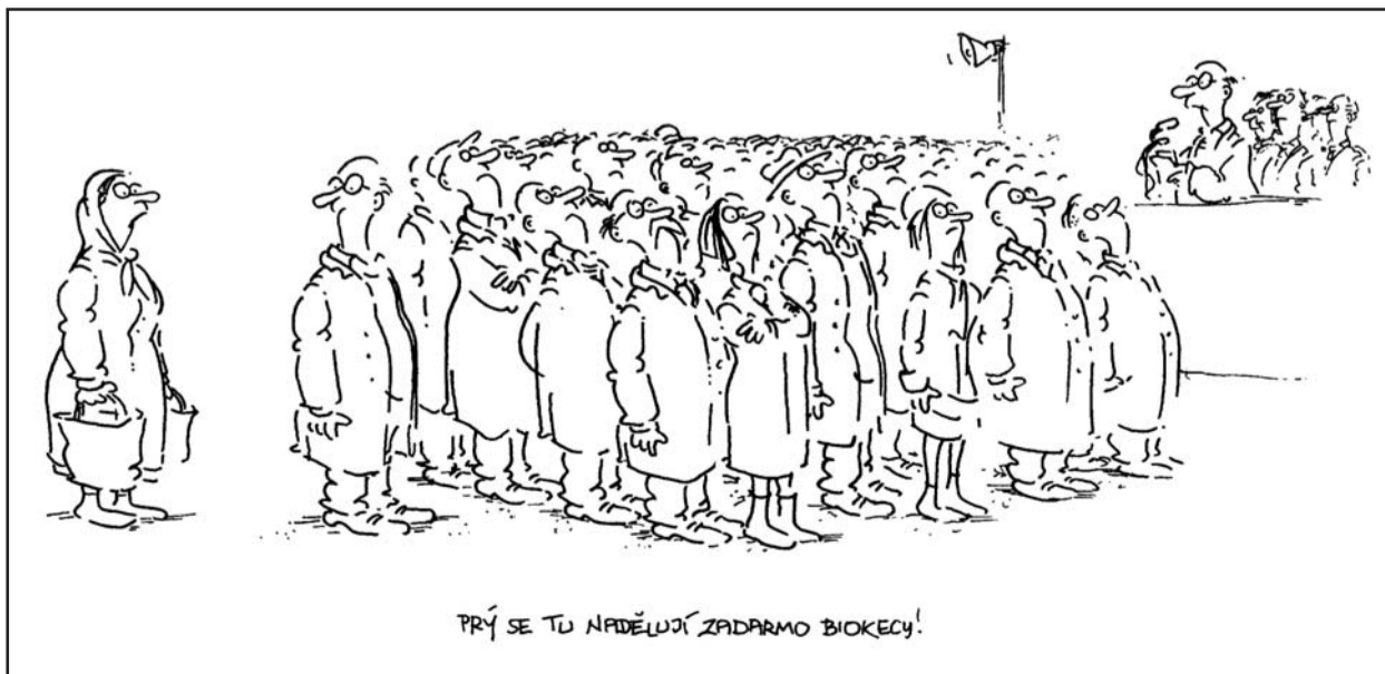
PRÝ SE TU NADELUJÍ ZADARMO BIOKECY!

Ochrana životního prostředí je nepochybně příkazem doby. Ale pouhými „kecy“ se žádných výsledků nedosáhne. (ori)