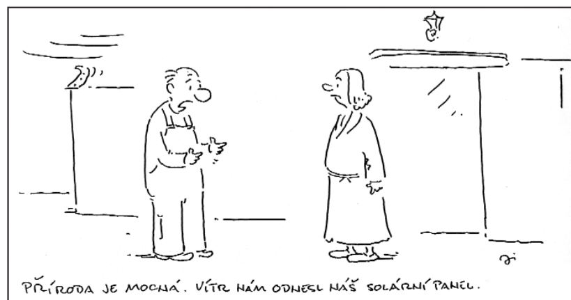
PŘÍRODA JE MOCNÁ. VÍTR NĀM ODNEŠL NĀŠ SOLÁRNÍ PANEĽ.