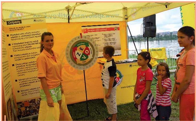
Šipky a kolo štěstí baví nejvíce plzeňské děti.

N a jiném místě tohoto čísla Teplárnika je řeč o ruletě, což je takový přece jen noblesní hazard s představou spíše Monte Carla nežli české kotliny.