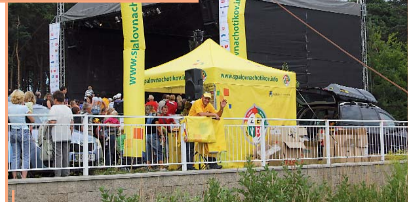
Žlutý prezentační stan spalovny ZEVO Chotíkov nelze nikde přehlédnout.

a) Zásadní odpůrci. Debaty s nimi sice vedeme, ale už předem víme, že jsou marné. Ty lidi nepřesvědčí